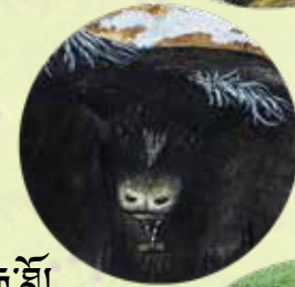
ཡ་རུ་རྒྱ་མོ།