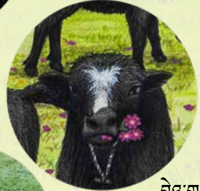
མཱེ་གཡ་གཡ།