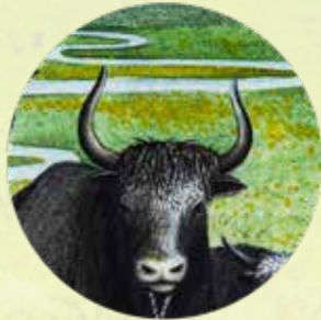
གཡ་སྐ་མ། (འབྲི།)