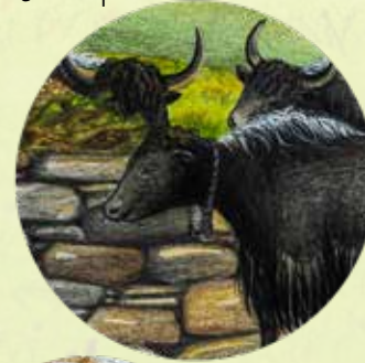
རྒྱ་སེ་མ། (མུལ་མ།)