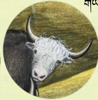
གཡཱི་དུང་མགོ།