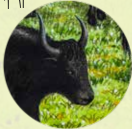
གཡག་རོག་ཚོད།