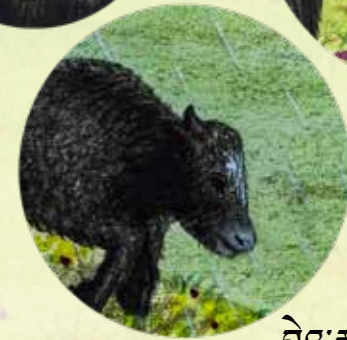
མཱེ་རྒྱ་འཛི།